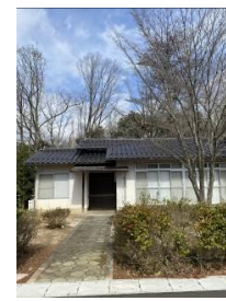
ショートステイハウス