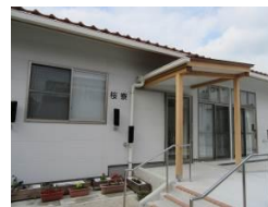
桜 (女子) 寮