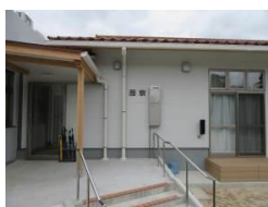
藤 (男子) 寮