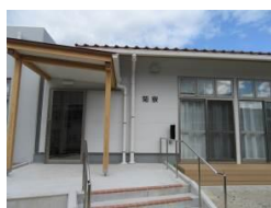
菊 (男子) 寮