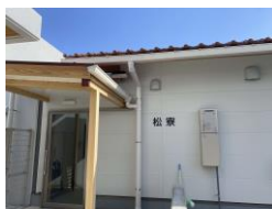
松 (男子) 寮