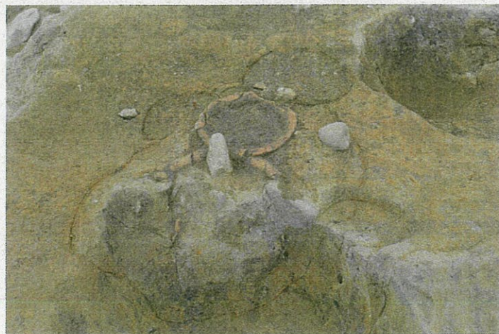
土器埋設遺構検出状況