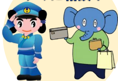
島根県警察 シンボルマスコット みこびーくん