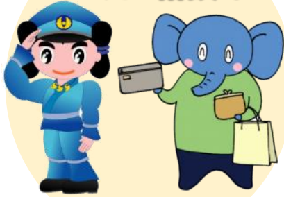
鳥根県警察 シンボルマスコット みこびーくん