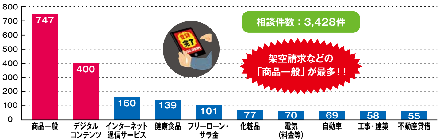
〈商品・サービス別苦情相談件数〉

平成30年度に島根県消費者センターが受け付けた相談件数は、 3,428件 で前年度に比べ 495件(12.6%) 減少しました。