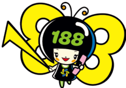
消費者庁 消費者ホットライン188 イメージキャラクター「イヤヤン」