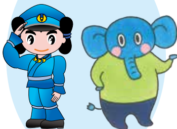
島根県警察 シンボルマスコット みこびーくん