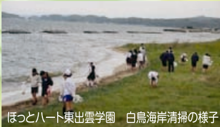
ほっとハート東出雲学園 白鳥海岸清掃の様子

東出雲中学校では、人間関係・社会関係形成能力を育てることを目標とし、生徒会主催の地域貢献活動が行われた。活動に際しては生徒会発案で校区3つの小学校にも活動が呼びかけられ、小中合同の地域貢献活動を展開。