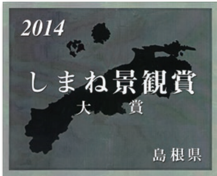
しまね景観賞表彰銘板