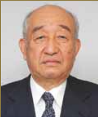
しまね景観賞審査委員会 委員長