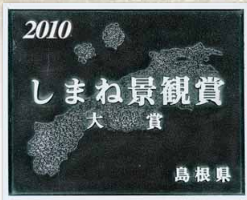
しまね景観賞表彰銘板