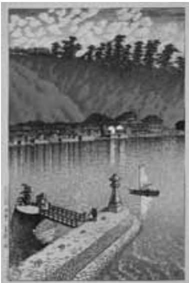
旅みやげ第三集より 「出雲美保ヶ関」 大正13(1924)年 多色木版・紙 (島根県立美術館収蔵)

川瀬巴水は、版元・渡部庄三郎のすすめでこの時期、精力的に全国を取材旅行し、数々の風景版画を版行している。「旅みやげ第三集」は全28図を数え、本作以外に松江の堀川沿いの風景版画などを含む。本作は美保関にある石灯籠を描いたものであるが、空気の澄んだ朝の時間を選び、水面を大きくとって清々しい美保関の朝の空気を伝える。現在とは少し位置関係や見える景色などが異なるが、祠も石灯籠も美保ヶ関に現存する。