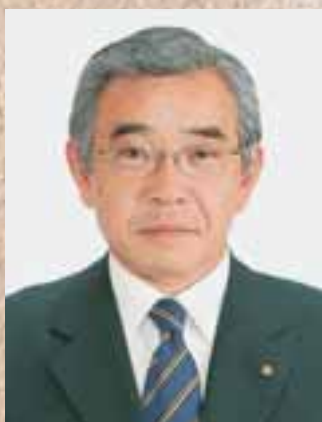
島根県知事 溝口善兵衛

私たちのふるさと島根では、緑織りなす山並みや変化に富んだ海岸線、日本海に浮かぶ島々などの美しい自然、人々の営みから創り出された農山漁村の風景、今日まで大切に守り引き継がれてきた先人の知恵が生かされた歴史的なたたずまいなど、それぞれに個性豊かな特色ある地域の景観が生まれ、かたちづくられています。