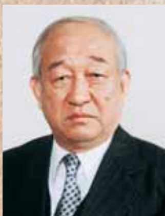
しまね景観賞審査委員会 委員長