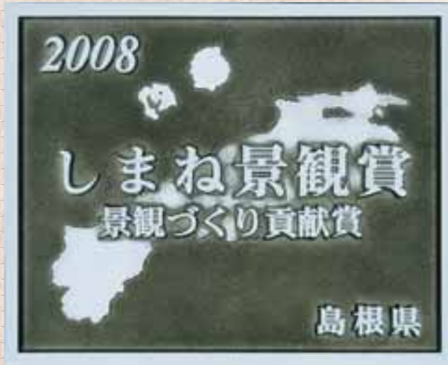
しまね景観賞表彰銘板