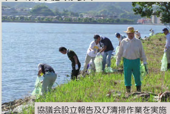
協議会設立報告及び清掃作業を実施