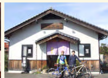
うなぎ処「山美世」で昼食