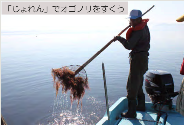
「じょれん」でオゴノリをすくう

地元漁師さんの指導のもと、早速「じょれん」を使って底をすくいあげると、たちまち船上はみずみずしいオゴノリの山。