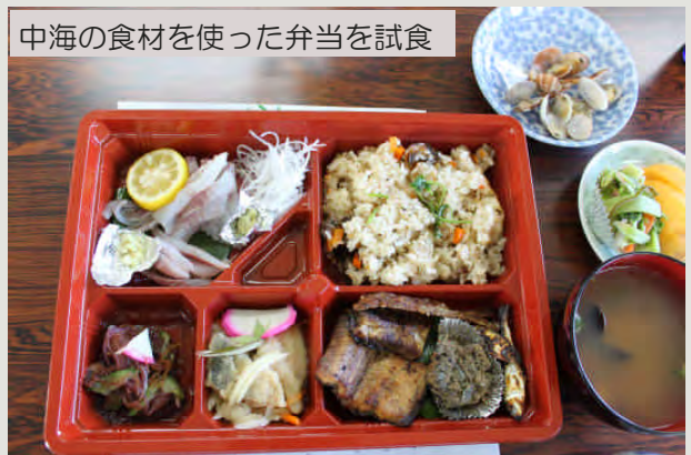
中海の食材を使った弁当を試食

平成23年度から、鳥取県・島根県が連携・協力し、海藻の回収事業、肥料や健康食品等への利活用に係る調査研究を実施する予定です。