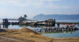
廃船、幻想的な光景