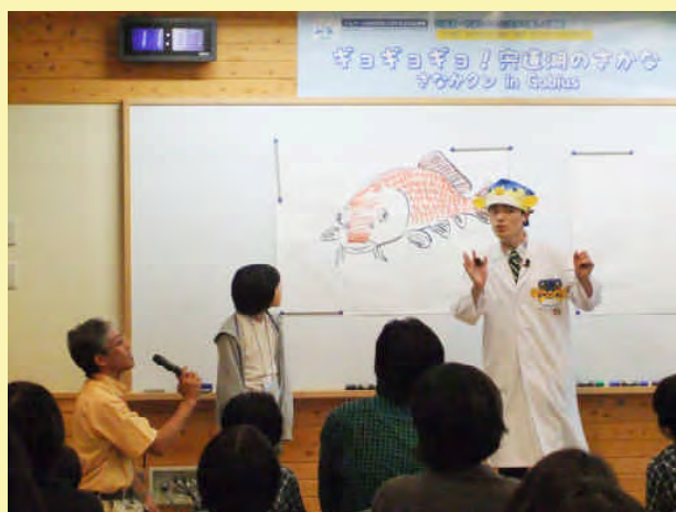
さかなクンの講義(ゴビウス レクチャールーム)

※この講座は、全国モーターボート競走施行者協議会からの拠出金を受けて実施しました。