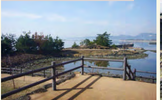
弁天島公園でひと休み