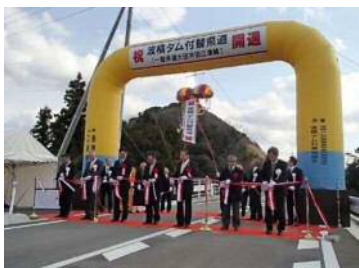
テープカットで開通を祝いました