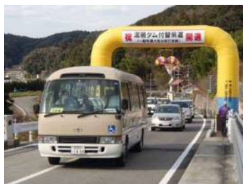
地元の方も車に乗り込んで渡り初めを行いました