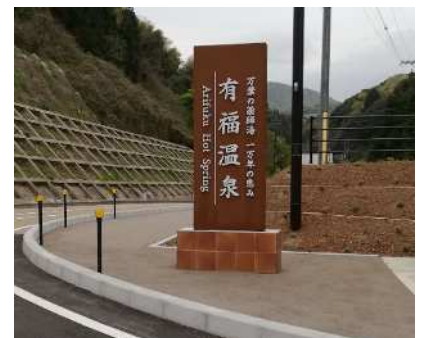
【修景に配慮した整備】