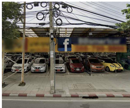
タイローカルの中古車店（テント）

タイでは、安い中古車を購入する際に基本的に、テントと呼ばれるタイローカルの中古車店で購入します。ですが、それらの店の中古車の品質は様々です。安全性と品質を求める中間層以上のタイ人、またはタイ駐在の日本人の、質の高い中古車の需要は高いため、市場は決して小さくはありません。以下の通り、既に市場に参入している日系のプレイヤーをいくつかご紹介します。