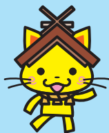
島根県観光キャラクター 「しまねっこ」 島観連許諾第7934号

これから先の未来が、実りある充実したものでありますように。私たちは、皆さんのご活躍をお祈りしています。