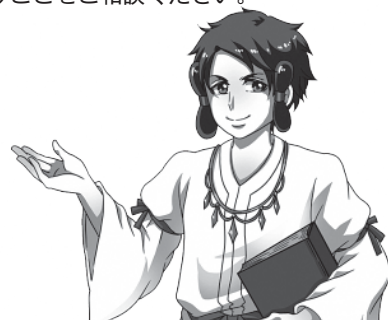
島根県労働委員会キャラクター ラルコス