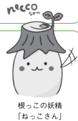
根っこの妖精 「ねっこさん」