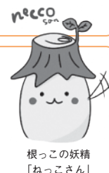
根っこの妖精「ねっこさん」