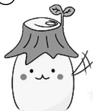
根っこの妖精「ねっこさん」

当日は、各科の催し物や屋台が並び、また美容科のステージ・パフォーマンスなどイベントも盛りだくさんですよ！