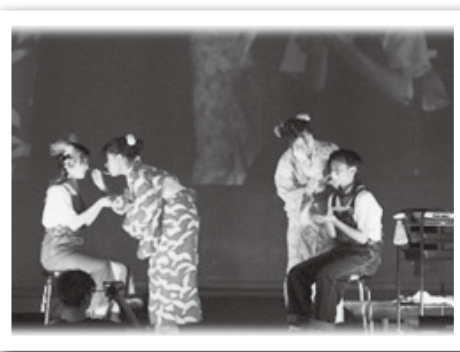
ステージ・パフォーマンス（美容科）