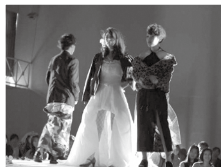
ステージ・パフォーマンス（美容科）