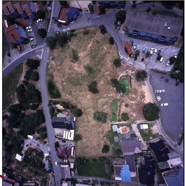
真上から見たスクモ塚古墳