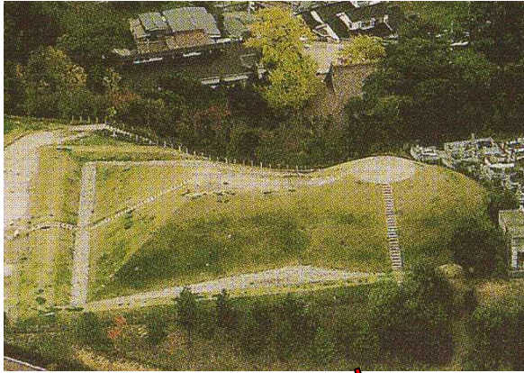
↑ 上から見た 小丸山古墳

益田市には、大型の古墳が多く造られています。古墳時代の5世紀に造られたスクモ塚古墳や、6世紀初めごろの小丸山古墳があります。