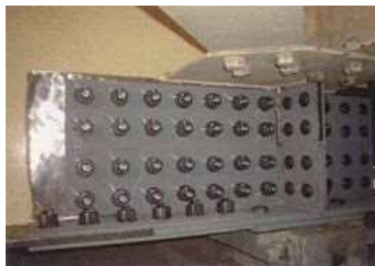
写真 4-1 当て板工実施状況