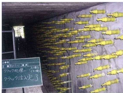
写真 4-2 ひび割れ注入状況

ひび割れ部分にエポキシ樹脂材、ポリマーセメントなどの補修材料を深部まで注入し、ひび割れ部を塞ぐ工法です。ひび割れを塞ぐことにより、劣化因子（水分、塩化物など）の侵入を防止しコンクリートの耐久性を向上することができます。