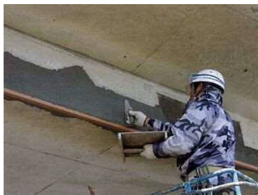
写真 4-3 断面修復状況

欠損した断面を下地処理後、コテ、ヘラなどによって断面修復材を塗り込んで断面を修復する工法です。断面修復材料は、ポリマーセメントモルタルなどが用いられます。大規模な断面欠損箇所に対しては、吹付工法を採用することもあります。