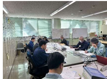
災害対策本部会議の様子