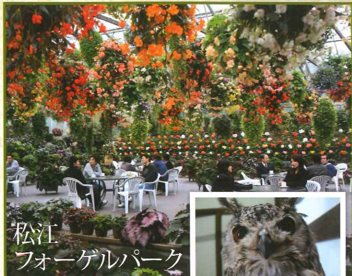
松江 フォーゲルパーク

주소: 야스기시 후루카와초 320 전화: 0854-28-7111 개관시간: 4~9월/ 9:00~17:30 10~3월/ 9:00~17:00 연중무휴 교통: JR야스기역에서 택시로 약 20분 거리. 무료 셔틀버스: JR야스기역에서 1일 8회 왕복. JR요나고역, 요나고 공항에서 1일 1회 왕복. 다마쓰쿠리온천, 가이케온천에서 1일 1회 운영.