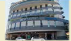
【スタート地点周辺駐車場】 西郷港埠頭立体駐車場【有料】 TEL.08512-2-5094