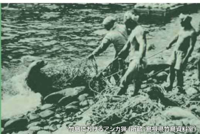
竹島におけるアシカ猟