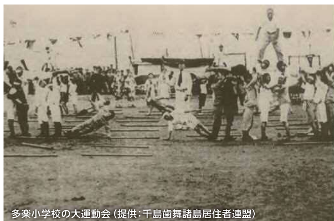
多楽小学校の大運動会