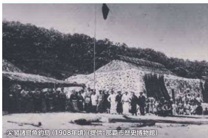
尖閣諸島魚釣島 (1908年頃)