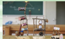
どんぐり松ぼっくり工作