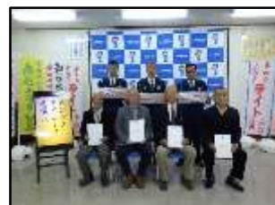
鹿足ケアテイカーズ委嘱