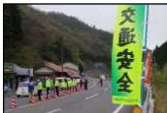
交通安全テント村開催