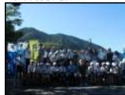
津和野あいさつ運動