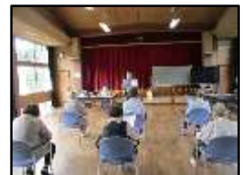
高齢者サロンでの防犯教室