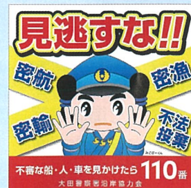
【仁摩町内に設置した看板】

大田警察署沿岸協力会は、沿岸部の安全安心を届けるため、街頭防犯カメラや看板の設置を行っています。令和7年度中は新型カメラへの交換、看板の修繕を行いました。