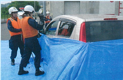
【ガラスを割って人命救助】

大田市消防本部との協力的なタッグにより、巨大地震や未曾有の豪雨を想定した実践的な訓練を実施。防災の要として、大田警察署は大田消防署などの防災関係機関と日々連携しています。