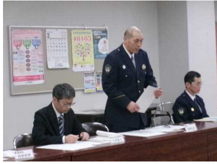
【運営指針説明状況】