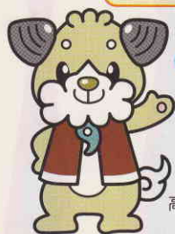
高齢者おうえんキャラクター しままる