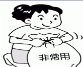
非常持ち出し品チェック表