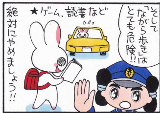
まんが 柏屋コッコ