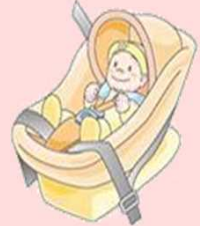
●乳幼児シート おおむね体重10kg未満