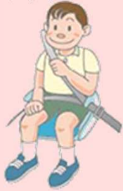
●児童用シート(ジュニアシート) おおむね体重15～36kg以下 4歳ころから10歳ころまで