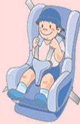
●幼児用シート おおむね体重9～18kg以下 1歳ころから4歳ころまで