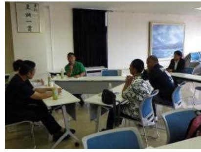
【委員間の討議状況】