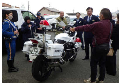
【白バイの説明状況】