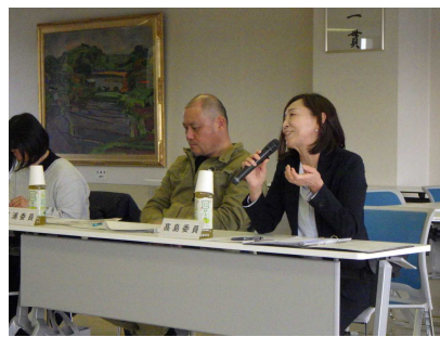
【委員からの提言状況】