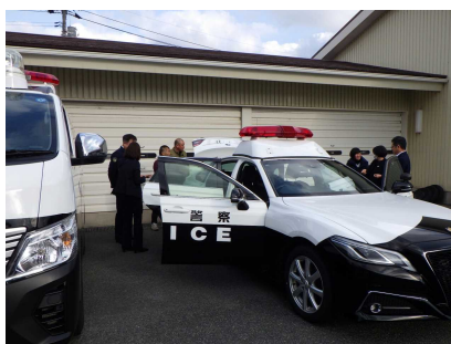
【警察車両の展示状況】