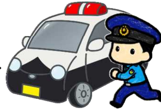
指令を受けた交番や駐在所の警察官が現場に行きます。