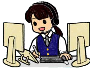
島根県警察本部で受理し各警察署・警察官に指令を出します。