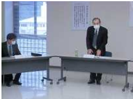
○花田会長あいさつ