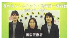
情報モラル教室 (YouTube 島根県警察公式チャンネル)