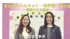
保護者のための Q&A (YouTube 島根県警察公式チャンネル)

少年補導職員と 少年補導委員(ボランティア)が 動画を作りました。 ぜひ、ご覧ください！