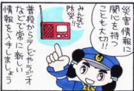
まんが 柏原コッコ