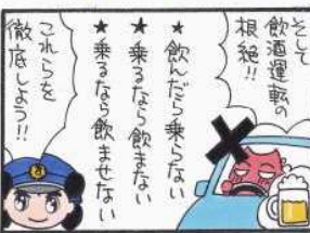
まんが 柏屋コッコ