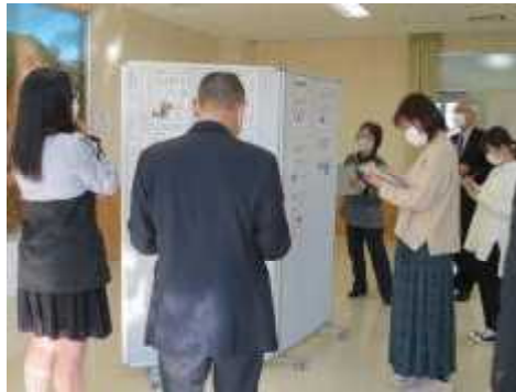
【広報紙コンクール】