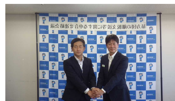
暴力団離脱支援に関する申合せ