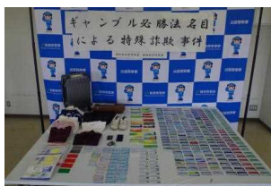
特殊詐欺事件の証拠品