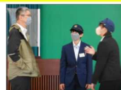
職務質問技能訓練