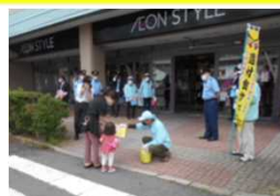
特殊詐欺被害防止広報啓発活動