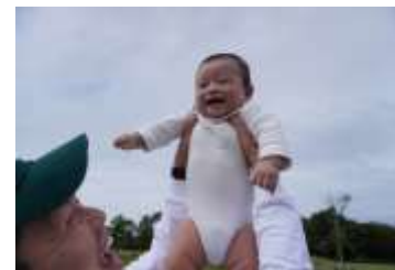
産後パパ育休の取得促進