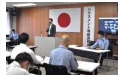
ハラスメント相談員 研修会の開催