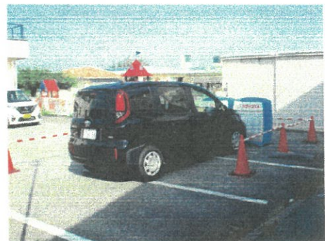
【安全運転サポート車乗車体験】