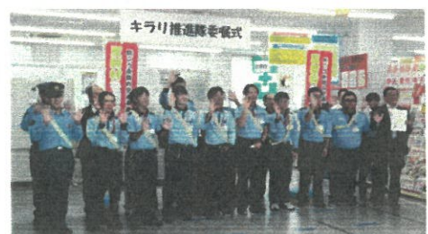
【キラリ推進隊の委嘱】