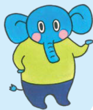
島根県消費者センター マスコットキャラクター だまされないゾウくん