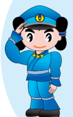
島根県警察 シンボルマスコット みこびーくん