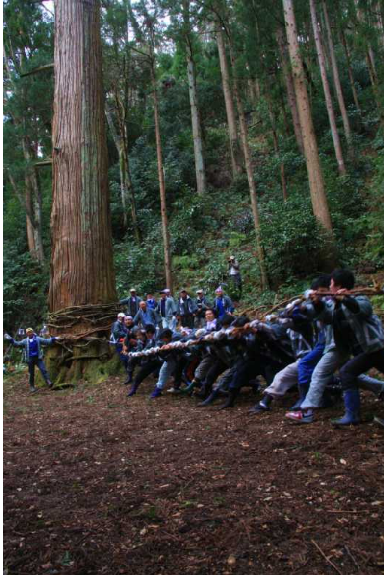
県指定無形民俗文化財「布施の山祭り」