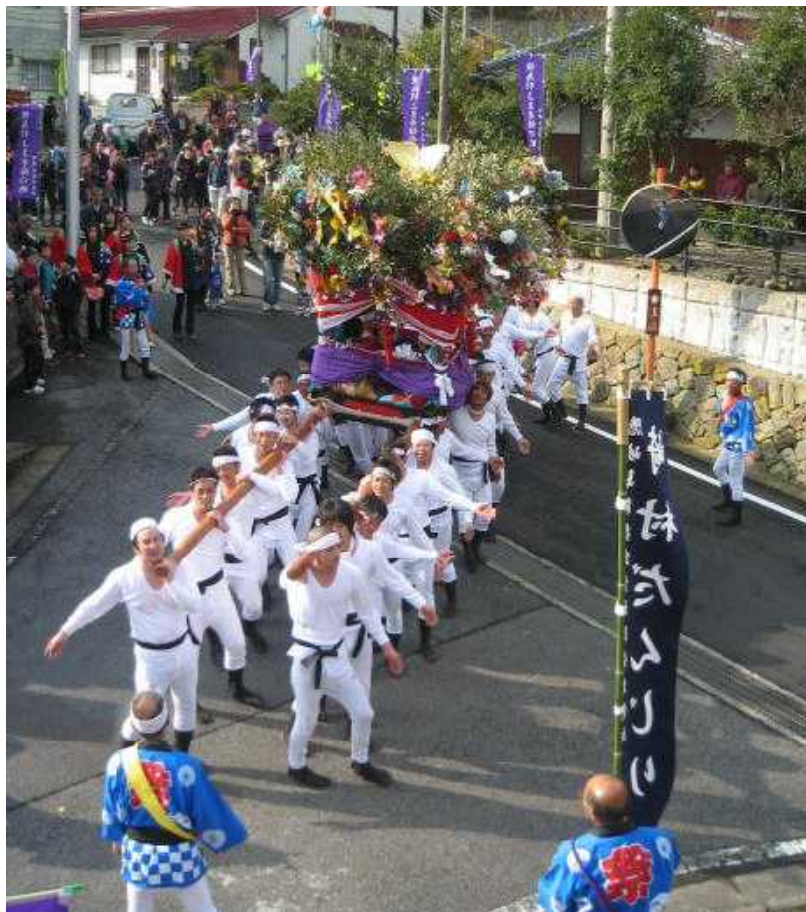
無形民俗文化財（海士町指定） 「恵美須祭の風流（崎村だんじり）」