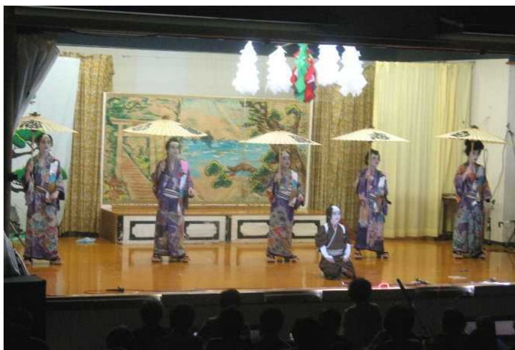
有形文化財（知夫村指定）天佐比古命神社芝居小屋にて催される子ども歌舞伎 『白波五人男』の1場面