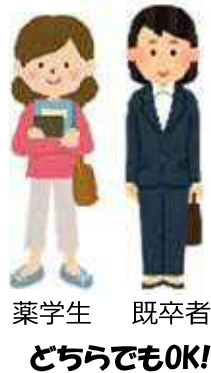
薬学生 既卒者 どちらでもOK!

在学時に奨学金の貸与を受けた薬剤師の方が、県内の登録を受けた医療機関・薬局に就業した場合、就業期間中の奨学金返還を県と事業者が共同で助成します。